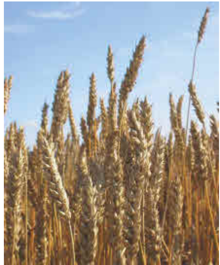
Immer mehr Getreide und Hülsenfrüchte werden an Schlachttiere verfüttert.

Allein in der Schweiz werden jährlich rund 1 600 000 Tonnen