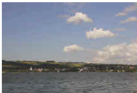
Die Idylle trägt – der Sempachersee muss seit den 80er-Jahren künstlich beatmet werden.

der Anteil der Landwirtschaft an der Wasserverschmutzung grösser als der aller Städte und Industrien zusammen! 31