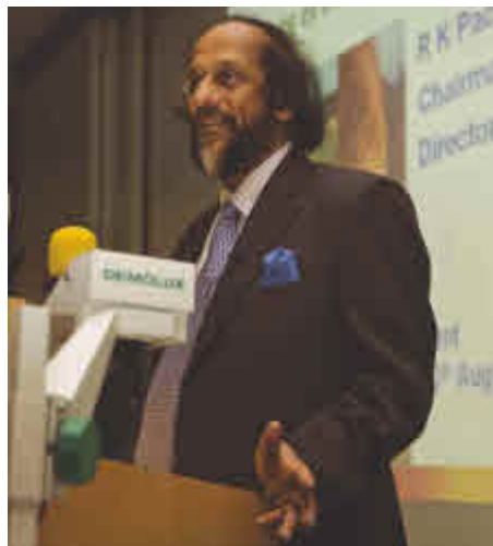
Rajendra Pachauri, Vorsitzender des UNO-Weltklimarates: «Bitte essen Sie weniger Fleisch – Fleisch ist ein sehr CO 2 intensives Produkt.»

Um die Auswirkungen unserer Ernährung auf das Klima zu reduzieren, empfehlen Umweltverbände oft, auf regionale und biologische Nahrungsmittel zurückzugreifen. Doch Bio allein ist keine Lösung für das Klimaproblem. Deutsche Wissenschaftler haben in Untersuchungen festgestellt, dass es für den Ausstoss von Klimagasen weniger relevant ist, ob