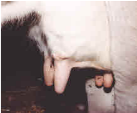
Das extrem beanspruchte Milchkuheuter benötigt oft Medikamente gegen Entzündungen. Die Medikamente gelangen danach direkt in die Umwelt.

Alle Medikamente und Hormone (z.B. in den USA weit verbreitet, um die Milch- und Fleischleistung zu steigern), welche den Tieren verabreicht werden, landen früher oder später über Fleisch, Milch, Eier und Fäkalien wieder in der Umwelt. Die Langzeitfolgen davon sind bis heute noch kaum absehbar.